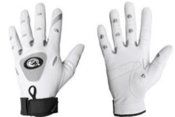
Bionic Tennis Gloves – dames (wit-grijs)