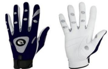
Bionic Tennis Gloves – jeugd (blauw-grijs)