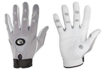
Bionic Tennis Gloves – heren (grijs/wit)